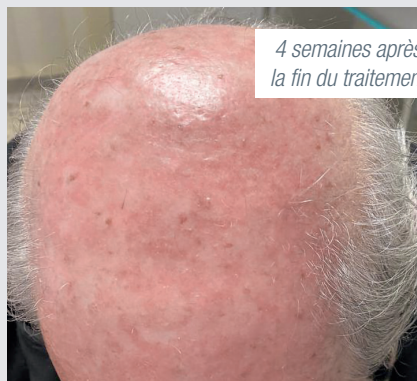
4 semaines après la fin du traitement