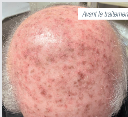
Avant le traitement

Voici à quoi peuvent ressembler les réactions cutanées habituelles: