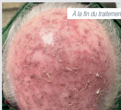
À la fin du traitement